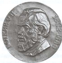
Президиумом РАМН «Терапевтический архив» награжден медалью С.П. Боткина